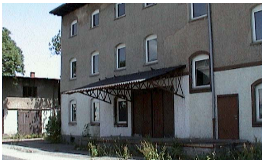
Das Explosiv vor dem Umbau.

Im Februar 2007 zogen wir mit Sack und Pack in das Objekt Bahnhofgürtel 55a, für das wir uns im Jahr 2006 als neuen Standort entschieden hatten. Sofort begannen wir mit den Planungsarbeiten und ersten vorbereitenden Baumaß-