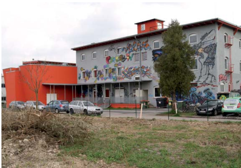
Das Explosiv nach dem Umbau.

In all diesen Jahren wurden wir von einer Vielzahl von Organisationen und Personen unterstützt, die wir