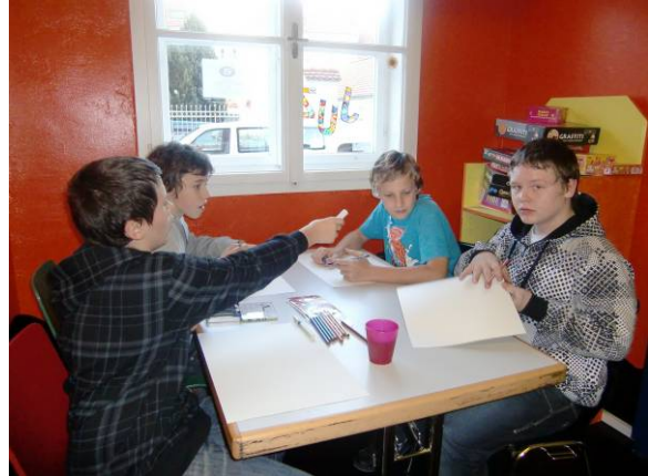
Die Jugendlichen beim Zeichnen ihrer Lieblingsplätze