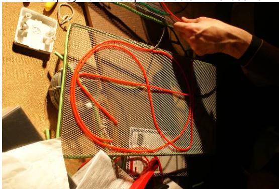
Die Ziffern für den Countdown werden von den Jugendlichen gebaut und zu einer gesamten Zeile zusammengefügt.