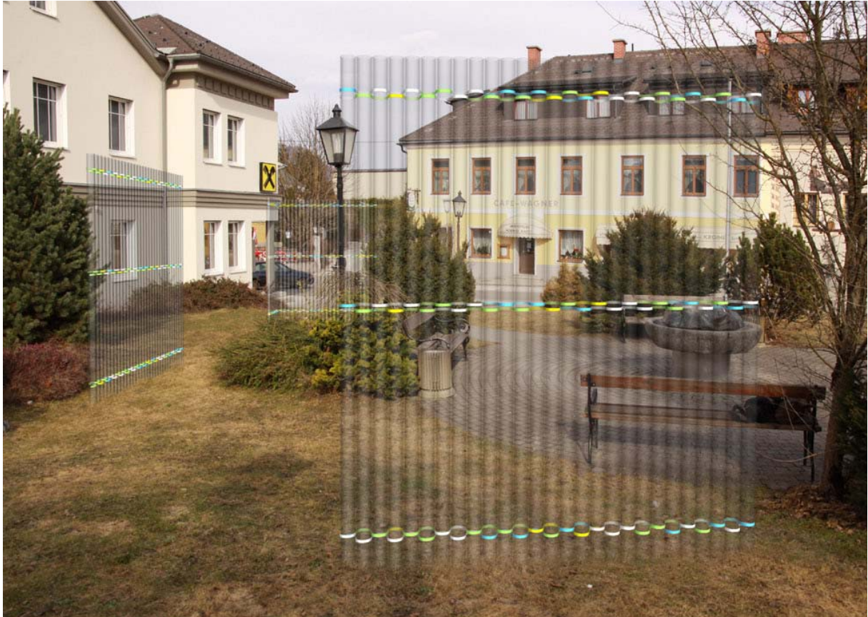
Visualisierung: „Bollwerk“, Zweintopf

So wird gemeinsam mit den Jugendlichen ein eigenes JUZ Gesäule – Armband entworfen, das für das Pflegen von Freundschaften, Gemeinsamkeit und Spaß stehen soll. Als Kunstwerk im öffentlichen Raum ist ein sogenanntes „Bollwerk“ geplant, das aus durchsichtigen Acrylglasstäben besteht und von gesammelten Armbändern der Jugendlichen zusammengehalten werden soll.