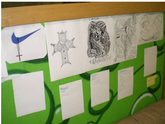
Fertige Entwürfe der Tatoos