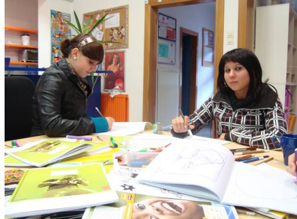
1. Workshop – Zeichnen und Entwerfen von Tatoos