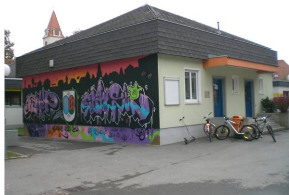
Nach dem Besuch von Delaine & Damian wird eigeninitiativ die Seitenwand des Jugendzentrums von den Jugendlichen gestaltet

Die KünstlerInnen Delaine & Damian Le Bas wurden im ClickIn in Gratwein mit Neugierde empfangen. Nach einem kurzen Kennenlernen machten sich die Jugendlichen mit den KünstlerInnen auf den Weg und führten sie zu ihren Lieblingsplätzen in Gratwein. Als Einstieg kam es an den darauffolgenden Workshoptagen zu einem Tattoo-Wettbewerb, wo die Jugendlichen eifrig Tatoos zeichneten. Mit Hilfe von Einwegkameras konnten die