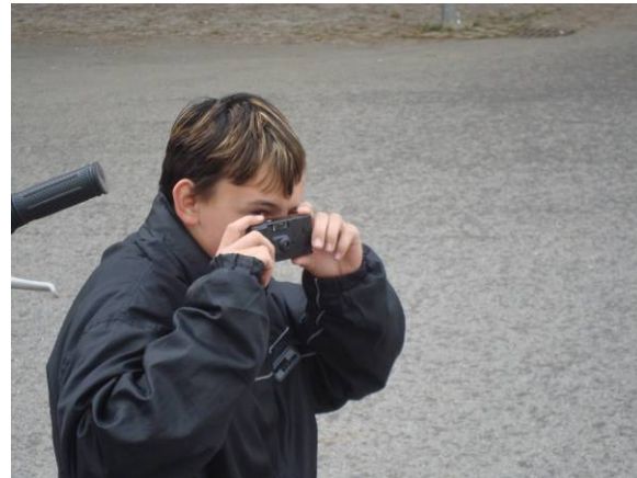
Die Jugendlichen bekommen Einwegkameras um ihre Umgebung festzuhalten