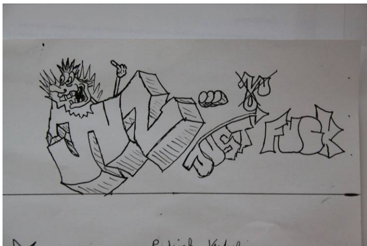
Logoentwurf für das JUZ Gesäuse – Armband