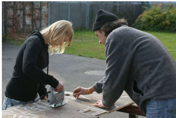
Beim Zuschneiden des eigens entworfenen Logos