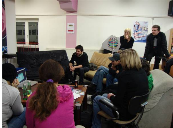
Gemeinsam beim Anschauen eines Videos