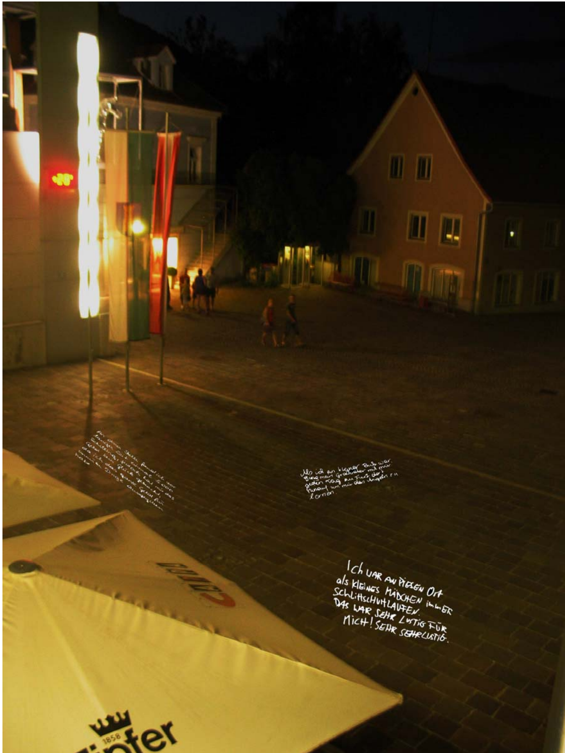
Visualisierung 2: Projektion im öffentlichen Raum