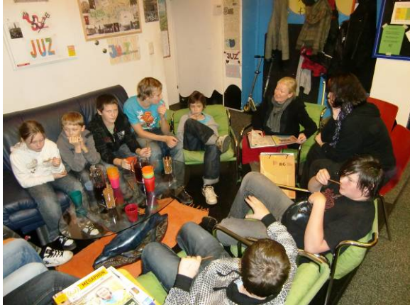
1. Workshop: Kennenlernen und Besprechen