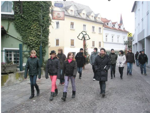
Die Jugendlichen zeigen Nasan ihr Köflach...