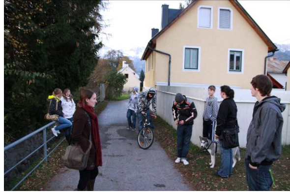
Unterwegs zu den Lieblingsplätzen der Jugendlichen