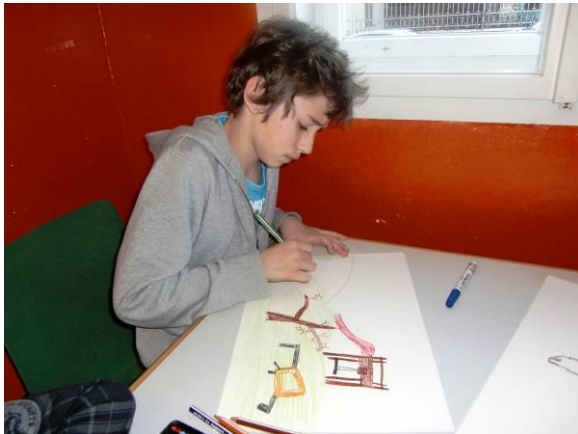
Konzentriert beim Zeichnen