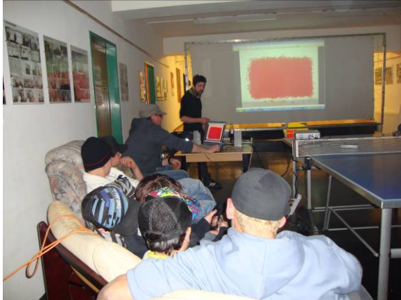
Nasan präsentiert den Jugendlichen bisherige Arbeiten