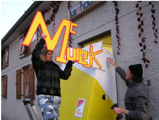
Der letzte Feinschliff- das Logo wird montiert