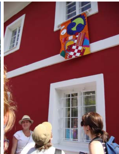
Impressionen des Eröffnungsrundgangs, Gratwein, 12.Juni 2010