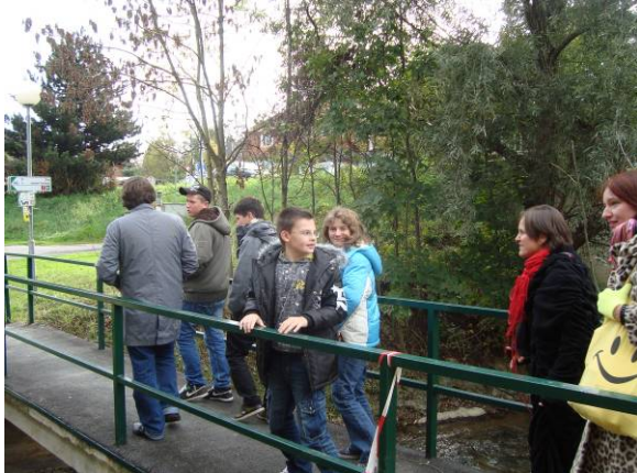
Erstes Kennenlernen beim Besichtigen der Lieblingsplätze der Jugendlichen

KünstlerInnen: Delaine & Damian Le Bas (Worthing, UK)