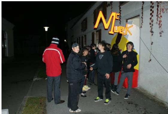
Der McMureck wird eröffnet!!