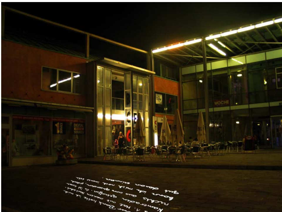
Visualisierung 1: Projektion im öffentlichen Raum

Für die Installation im öffentlichen Raum ist eine Projektion der Texte geplant, die ausschließlich bei Einbruch der Dunkelheit in der Nacht zu sehen sein wird. Verschiedene Textfragmente tauchen abwechselnd am Boden auf und sind für Interessierte lesbar. Die Eröffnung wird im Herbst 2010 sein.