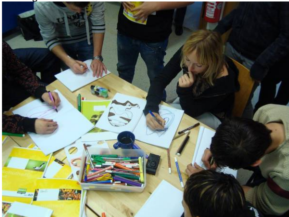
Es wird eifrig gezeichnet und begutachtet