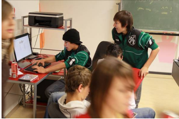
Zweintopf lernen den Alltag im JUZ kennen